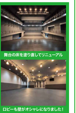
舞台の床を塗り直してリニューアル

長らくお待たせしましたが、ついに改修工事が終了し、4/1にリニューアルオープンを迎えることができました! 特定天井改修工事として、天井の取り外しを行いました。その他にも「反響板の新設、ロビーのリフォーム、舞台照明のLED化、トイレの洋式化……」等々、様々なリニューアルを行いました! ピアノやダンスの発表会はもちろんのこと、講演会や楽器練習でもご利用いただけますので、ぜひご検討ください!