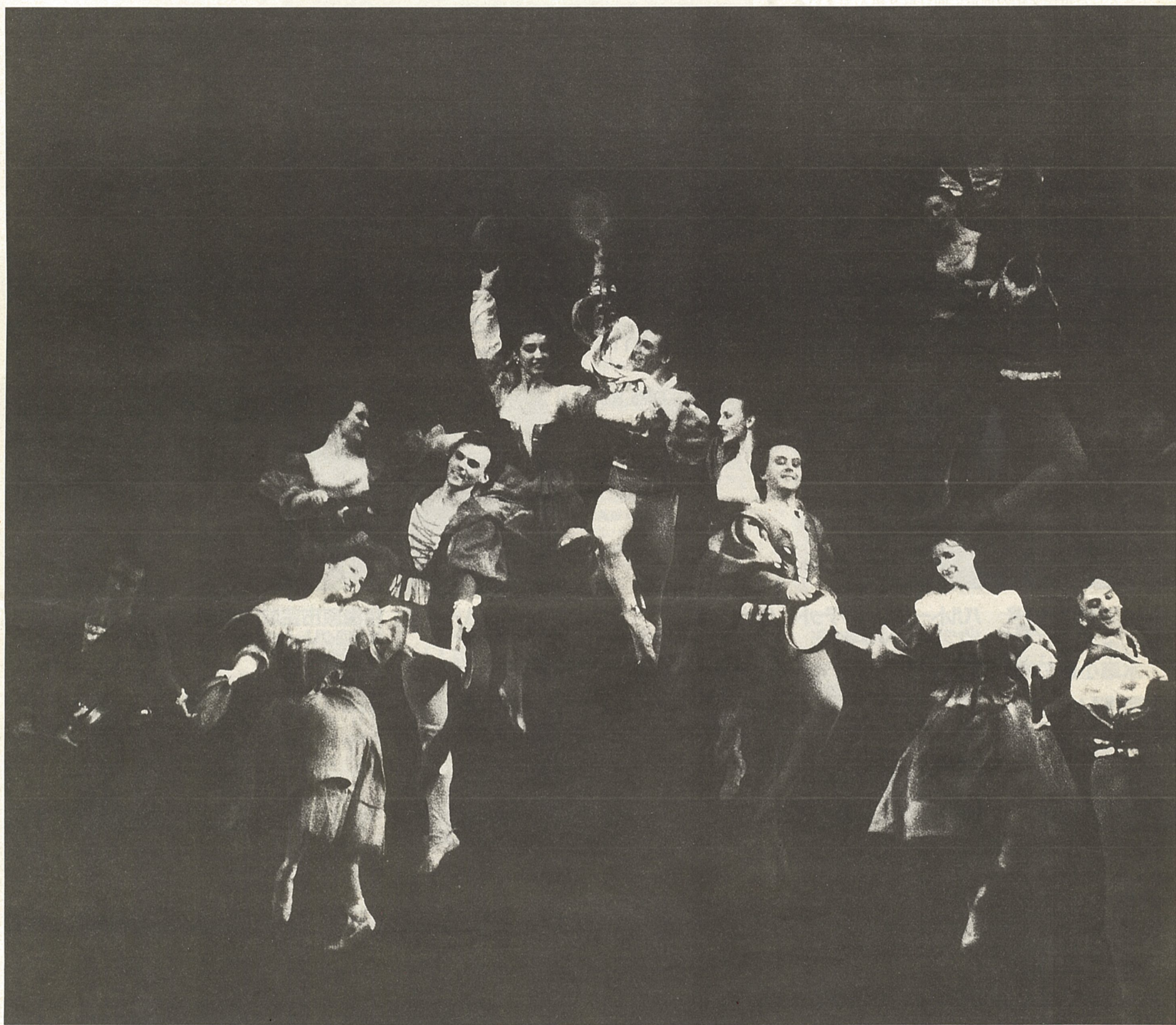
ポリショイ・バレエ『ロミオとジュリエット』より

発行：(財)相模原市民文化財団 ☎228 相模原市相模大野4-4-1 TEL 0427(49)2200 *毎月20日(月曜の場合は21日)発行