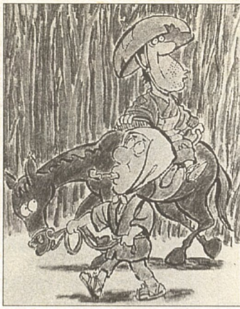
貧乏神にとりつかれた話(磯部)