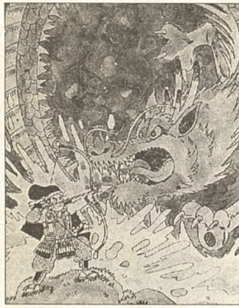
淵辺義博の竜退治(淵野辺)