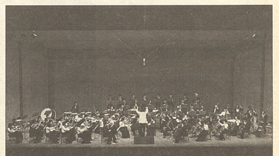
主催:相模原市民交響楽団 共催:(財)相模原市民文化財団

昭和56年9月に市内の音楽愛好家が集まって結成された相模原市民交響楽団が10周年を記念してグリーンホールでコンサートを行います。定期演奏会や第九演奏会など着実な活動を重ね実力を蓄えてきた同団の演奏にどうぞご期待ください。