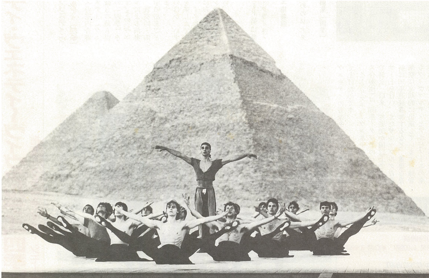
写真はいずれも「ピラミッド」(5月カイロ/エジプト公演)より

グリーンホール相模大野 情報・号外 発行:(財)相模原市民文化財団 相模原市相模大野4-4-1 電話(0427)49-2200 次号は8月19日発行予定です