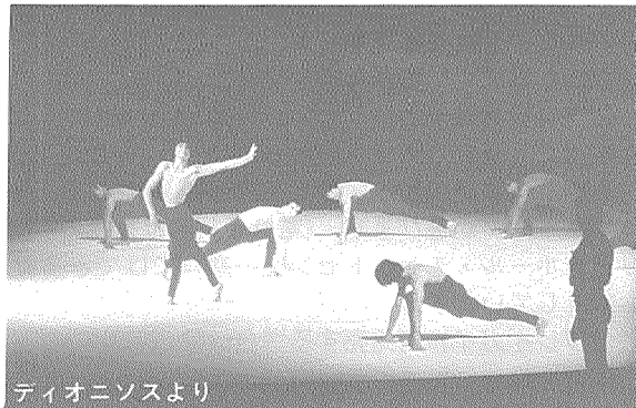
ディオニソスより

「今世紀最高の振付家」モーリス・ベジャールが注目の新作とともにやってきます。これまでに、「春の祭典」「ボレロ」「ディオニソス」など、作品を発表するたび世界中にセンセーションを巻き起こしてきたベジャール。そしてローザンヌに本拠地を置く「モーリス・ベジャール・バレエ団」。才気あふれる着想と強烈な個性によって創り出される舞台とその躍動する肉体は、時間や空間を超越した感動を人々に呼び起こします。