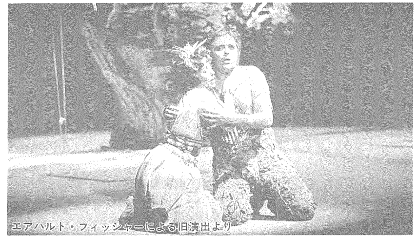
エアハルト・フィッシャーによる旧演出より